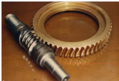
图 11 平面二次包络环面蜗杆传动