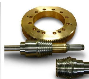
图 16 Cone 分段式环面蜗杆传动