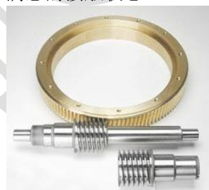
图 15 OTT 分段式蜗杆传动

齿侧间隙调整是在蜗杆轴固定、空心蜗杆受一定轴向预紧力的情况下进行的,通过旋转空心蜗杆,使得两截蜗杆的工作面与蜗轮齿发生接触,设置好齿侧间隙,用涨紧套将两截蜗杆固联。齿侧间隙的调整较方便,在磨损后重新调整齿侧间隙也能获得满意的接触状态。