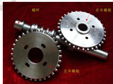
图 12 无侧隙双滚子包络环面蜗杆传动

蜗杆传动,并进行了啮合理论、参数优化、样机制造及性能试验等方面的系统研究,这种蜗杆传动是以滚锥作为母面包络展成滚锥包络环面蜗杆廓面,再以滚锥作为蜗轮齿与蜗杆廓面相啮合,具有传动效率高、承载能力大、使用寿命长及制造简单等优点;1997年长沙铁道学院刘鹤然 [57] 提出钢球包络蜗杆传动,具有结构简单、安装方便、传动效率高及使用寿命长等优点;2007年重庆机床厂金良治 [58] 等提出利用常规制造及装配工艺就能制造出的低成本高精度钢柱蜗轮-环面蜗杆传动副,其精度完全取决于计量水准而不受制于高精度的专用设备,目前可达3级精度,并已运用于高精度蜗轮母机的精密分度;2008年西华大学王进戈 [59] 等提出无侧隙双滚子包络环面蜗杆传动,如图12所示,该传动中的蜗杆是以蜗轮齿面为原始母面包络展成的环面蜗杆,蜗轮轮齿则是两个能够绕其自身轴线转动的滚子,该传动不仅具有滚子包络环面传动效率高、啮合齿数多、承载能力强等优点,还具有侧隙可调及零侧隙的特点。