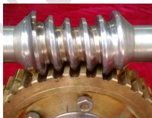
图 4 威氏蜗杆传动

我国六十年代便对威氏蜗杆传动开展研究, 并先后应用于河南豫西机床厂作滚齿机分度蜗轮、首钢炼钢转炉倾翻机构和南京天文台望远镜等。但该传动由于受到蜗杆齿根根切的限制, 一般只能用于传动比较大的场合。