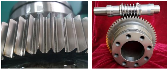
图 17 变齿厚渐开线齿轮包络环面蜗杆传动