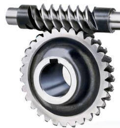
图 5 尼曼蜗杆传动

国内对圆弧齿圆柱蜗杆传动的研究始于六十年代, 并创造了可车削的轴面圆弧的 ZC3 型蜗杆传动 [8, 9] 。1969 年完成了部颁标准《圆弧齿圆柱蜗杆减速器》草案, 开始批量生产, 1979 年将草案正式修订为部颁标准。1986 年在部颁标准的基础上进一步修订为国家标准《圆弧圆柱蜗杆减速器》 [10] , 齿形改为可磨削的 ZCI 型 [11] 。