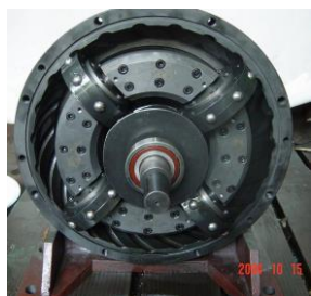
图 9 超行星环面蜗杆传动