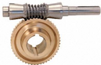
图 3 亨得利蜗杆传动