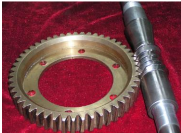
图6 侧隙可调式变齿厚平面蜗轮包络环面蜗杆传动

1999年重庆大学张光辉 [13] 通过对斜平面包络环面蜗杆传动进行深入啮合分析而巧妙设计提出一种新型精密动力蜗杆传动形式——侧隙可调式变齿厚平面蜗轮包络环面蜗杆传动,如图6所示。该传动的蜗轮轮齿的两侧齿面倾角不等,轮齿沿轴向呈楔形,并使左右两侧齿面的接触线都落在轮齿偏薄的半边,因而通过轴向移位,可以实现全部齿侧间隙的合理调整,除了具有斜齿平面蜗轮多齿啮合、承载能力和效率高的优点之外,还具有可制造精度高、齿侧间隙或空回量小、磨损可补偿等优点,克服了威氏蜗杆传动存在的弱点,实现了威氏发明平面蜗轮的初衷,是迄今所见优点最全面的高性能精密重载蜗杆传动。