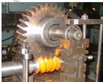
图 10 TI 蜗杆传动

在国内,1977年太原工学院朱景梓 [28] 等与太原钢铁公司合作,研制出 TI 蜗杆传动样机并进行传动性能试验,证明 TI 蜗杆传动副的效率比阿基米德圆柱蜗杆传动要高、齿面磨合良好且能够传递较高的载荷;1981年太原工学院段德荣 [29] 推导了二次包络 TI 蜗杆传动的啮合理论,并系统分析了齿面接触情况及界限曲线规律等;1982年南通市机械研究所张希康 [30, 31] 探讨了 TI 蜗杆传动中螺旋角的合理选择和接触线的分布等情况;天津大学王树人 [32] 、詹东安 [33, 34] 等推导了 TI 蜗杆传动的包络理论,建立了考虑加工误差和装配误差的啮合理论体系,得出一次包络 TI 蜗杆传动对误差的敏感性小,提出了精修磨的 TI 蜗杆磨削方法;天津大学孙月海 [35-37] 等分析得出 TI 蜗杆齿面磨削所需的精确砂轮廓形,磨削试制硬齿面 TI 蜗杆传动副,如图 10 所示,并进行传动性能试验研究并得出 TI 蜗杆传动副在较低的载荷下具有较好的传动性能,随着载荷的增加齿面的摩擦磨损加剧。