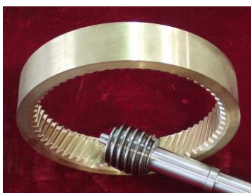
图 13 平面齿内齿轮包络鼓形蜗杆传动

1960年,美国 Popper B [65] 等提出一种由一外螺纹蜗杆与一内螺纹蜗杆组成的双蜗杆传动形式;1968年 Van Voorhis D M [66] 提出一种具有内啮合蜗杆传动的行星减速装置,该传动副由外齿圈和内螺纹蜗杆组成,其内螺纹蜗杆嵌套在外齿圈之上;1990年,美国学者 MacPhee J [67] 发明一种用于印刷机上墨装置中摆动辊筒的内啮合蜗杆传动,该传动由一外齿轮与一内螺纹蜗杆相啮合,其整个外齿轮位于蜗杆内部。